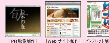
[PR映像制作] [Webサイト制作] [パンフレット制作]

コンテンツ開発: Webサイト・PR映像・カタログ・会社案内・プレゼン・会員誌などの制作